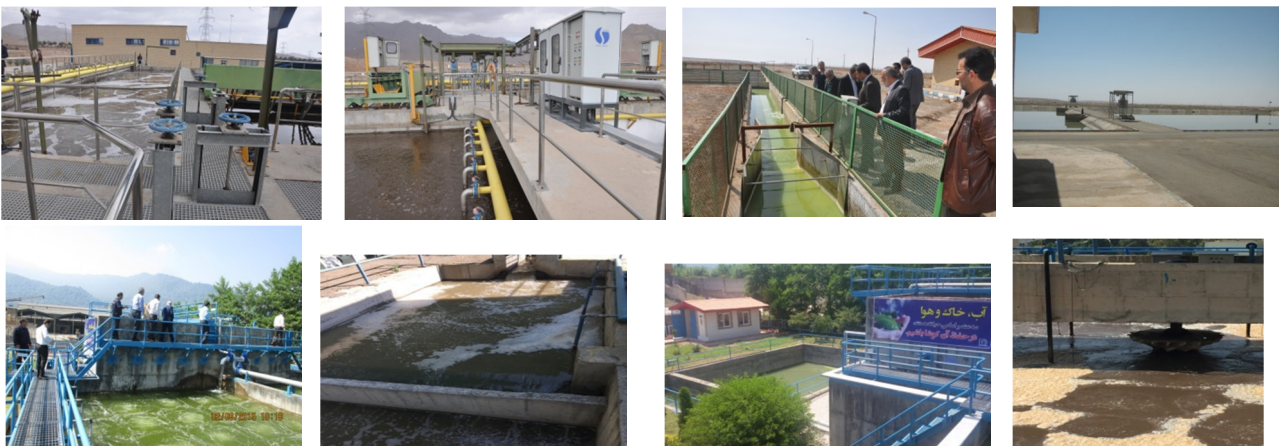
بهره برداری ، پایش و راهبری تصفیه خانه های فاضلاب شهرکهای صنعتی مازندران و آب و فاضلاب های استان تهران ، سمنان و مازندران

آدرس : ساری میدان خزرابتدای بلوارفرح آبادکوچه سروستان مجتمع تجاری اکباتان واحد ۹ کدپستی ۴۸۱۶۹۷۳۹۹۳