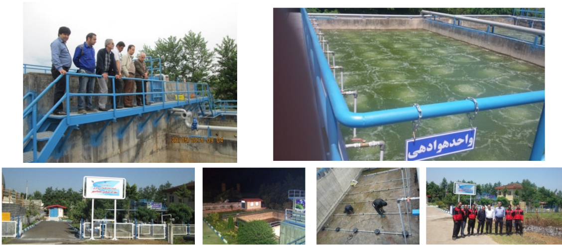
بازسازی و نوسازی تصفیه خانه مرکزی فاضلاب شهرک صنعتی سلمانشهر